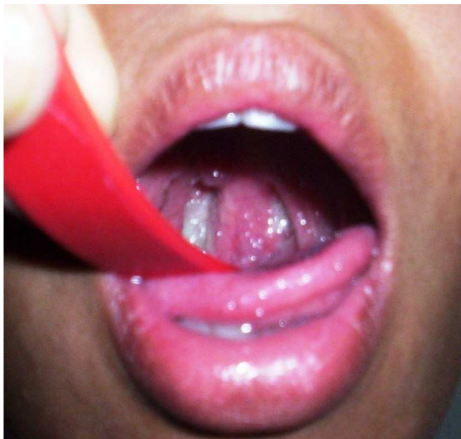
Figure 1. Paroi postérieure du pharynx inflammatoire avec ulcérations superficielles

Il s'agit d'une lycéenne de 19 ans, admise dans le service ORL du CHU d'Antananarivo pour une odynophagie importante, une toux ramenant des expectorations purulentes abondantes, et une voix voilée, dans un contexte fébrile, évoluant depuis trois semaines. L'examen clinique retrouvait une altération de l'état général, des signes de déshydratation, une fièvre à 39°C, de multiples adénopathies latéro-cervicales bilatérales centimétriques, des ulcérations superficielles avec des dépôts jaunâtres au niveau de la paroi postérieure du pharynx (Figure 1), et une hypertrophie amygdalienne bilatérale. Il existait des râles bronchiques et une matité diffuse des deux champs pulmonaires.